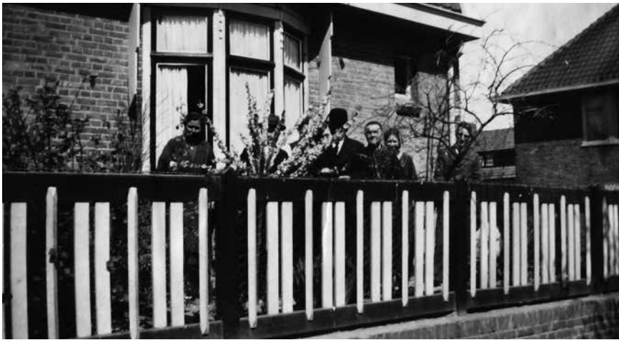
KIEKJE UIT FAMILIEALBUM MET DAAROP HET HOUTEN TUINHEK, GESCHILDERD IN DEZELFDE KLEUREN ALS HET HUIS.